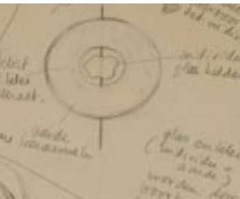
schets voor gedenkbeeld

den Heuvel. “Niemand brengt ook maar iets in rekening. Zelfs Van Deur tot Deur – de vervoerder van de beelden – doet het voor niks. Dat is de menselijke maat.”