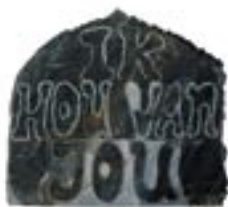
het gedenkbeeld in wording