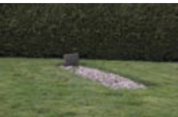
grafnummer 20, rij 1

kan ik niet. Hij is anoniem en dat is ook meteen het probleem dat je als zodanig moet laten bestaan. Het enige dat ik voor hem kon doen was stilstaan bij mijn eigen verlies. Ik heb mijn eigen emoties gebruikt om een monument voor hem te maken. Ik heb stenen gestapeld, donkere stenen, gele stenen, stenen met een goudnerf... ze passen prachtig in de Arabische traditie. En ik weet niet eens of hij Arabische wortels heeft. Ik hoop dat het stenen zijn die gebroken zijn in 't land waar hij vandaan komt.”