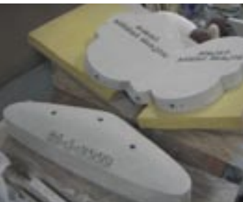
het gedenkbeeld in wording