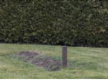
grafnummer 12, rij 1