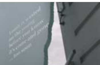
het gedenkbeeld in wording

‘Ze zoeken asiel terwijl ze van het leven nog bijna niks weten’