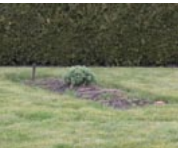
grafnummer 22, rij 1