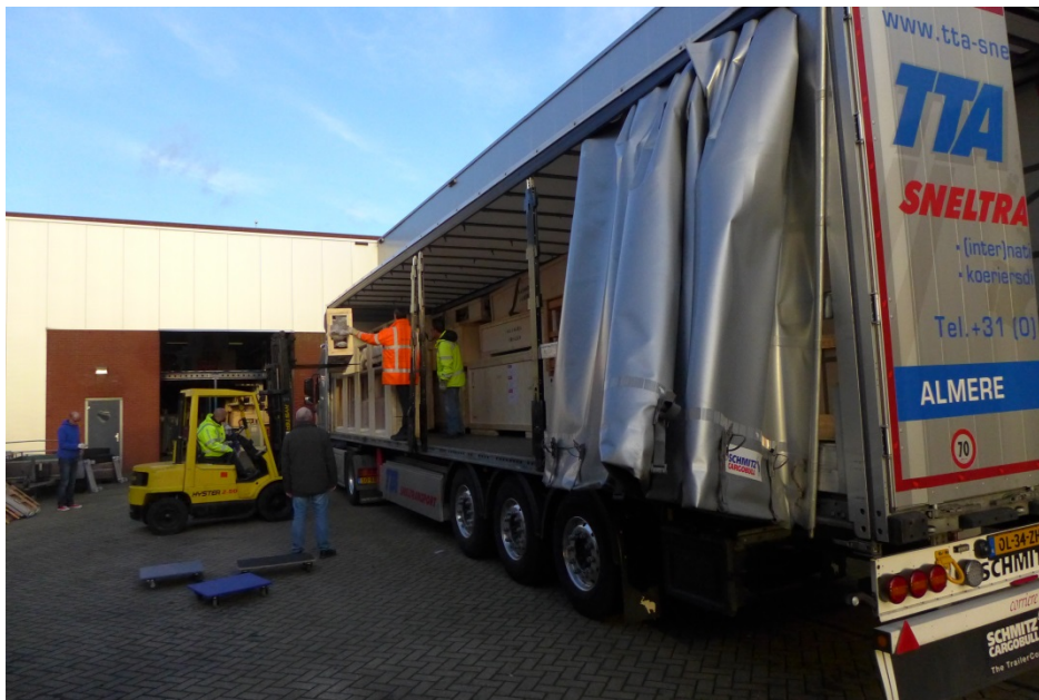
Afb. 17 Inladen van het ingepakte interieur.

Nadat we de afgelopen maanden de voorbereidingen voor het transport getroffen hebben, is de betimmering afgelopen vrijdag in een volgeladen vrachtwagen naar Rotterdam gebracht. Studenten meubelrestauratie en hun docenten zullen daar een week lang meehelpen om onderdelen van de kamer op te stellen en wellicht ook tijdens de tentoonstelling actief zijn.