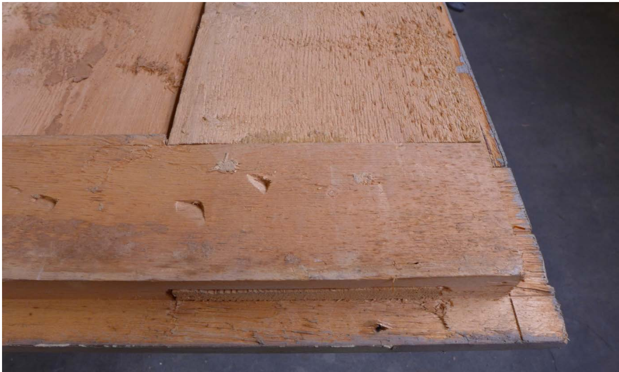
Afb. 9 Idem detail