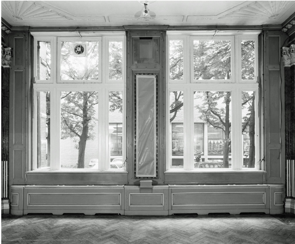
Afb. 12 Aanzicht van de raamwand in het SMA vlak voor afbraak van de stijkkamer in 1975.

De wand tegenover de dubbele deur was de raamwand. De vensters in het SMA hadden een ander formaat dan aan de Keizersgracht en bovendien waren er radiatoren. Dit werd door Roosen en zijn mensen netjes in stijl afgetimmerd met radiator-omkastingen die er enigzins uitzagen als lambriseringen. Verder kwam er een nieuwe muurdam tussen de ramen om de penantspiegel aan op te hangen.