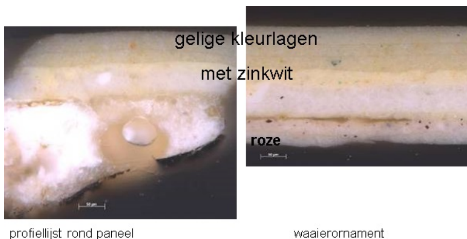
profiellijst rond paneel