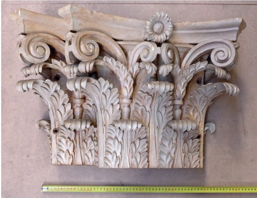
Afb. 16 Eén van de 10 kapitelen die erin verpakt zaten.

Nadat we de afgelopen maanden de voorbereidingen voor het transport getroffen hebben, is de betimmering afgelopen vrijdag in een volgeladen vrachtwagen naar Rotterdam gebracht. Studenten meubelrestauratie en hun docenten zullen daar een week lang meehelpen om onderdelen van de kamer op te stellen en wellicht ook tijdens de tentoonstelling actief zijn.