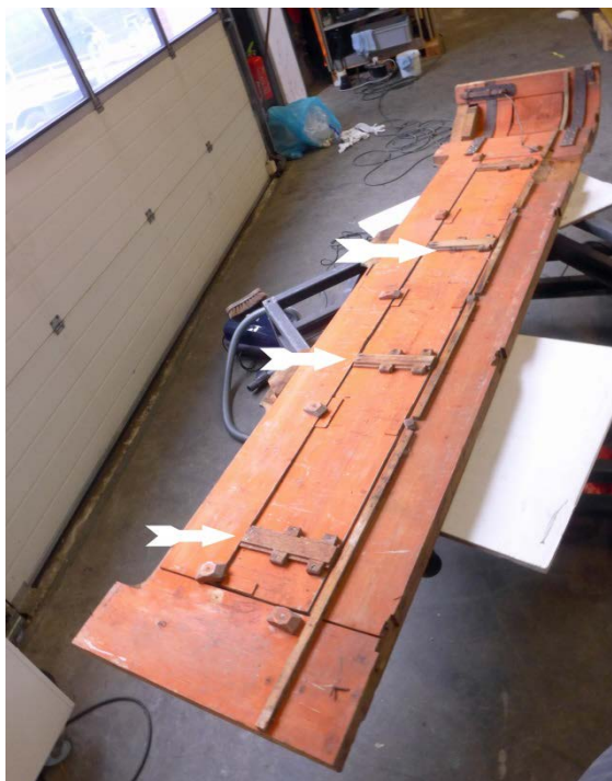
Afb. 13 De radiatoromkastingen zijn aan de achterzijde voorzien van schuifklampen om ze vlak te houden. Eenzelfde systeem van klampen is door Roosen c.s. op de achterzijde van enkele historische lambriseringspanelen toegepast.