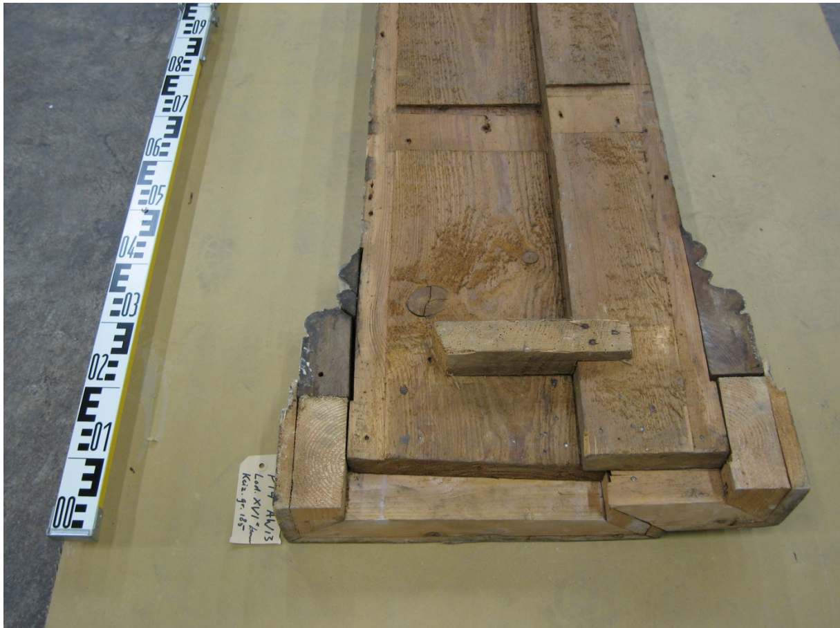
Afb. 6 De achterzijde van een pilaster basement met nieuw aangezette stukken plint.