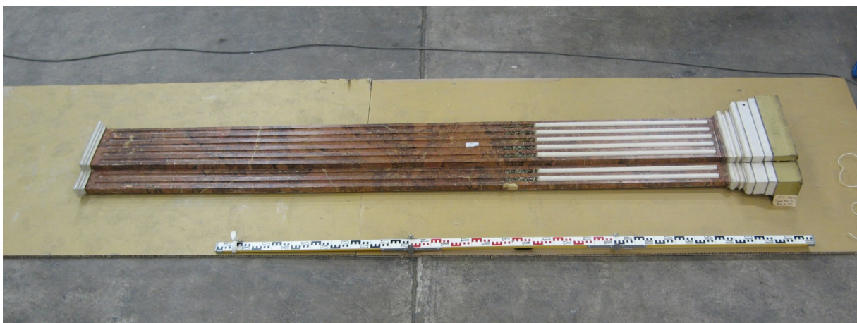
Afb. 4 Voorzijde pilaster

Bij nadere inspectie van de onderdelen is goed te zien hoe dit in zijn werk ging. De pilasters zijn ca. 50 cm. verlengd door er een stuk aan te schroeven.