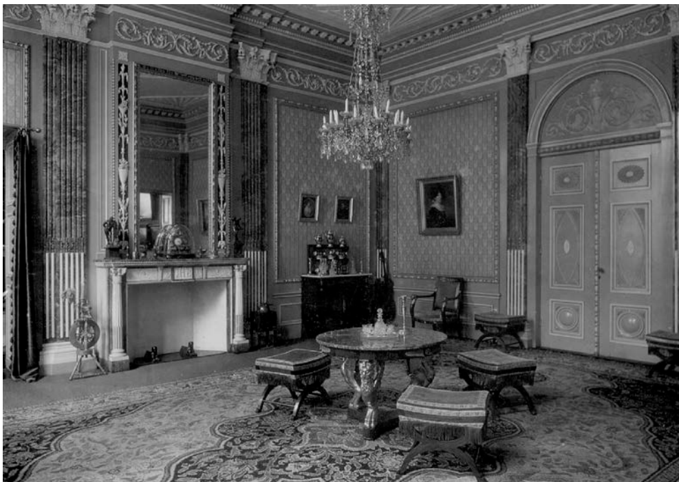
Afb. 2 Museumzaal nr. 21, Stedelijk Museum Amsterdam 1925 (KA 14525, 14527, 14528)