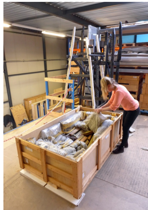
Afb. 15 Het controleren van een oud transport krat uit het SMA

In de opstelling in Rotterdam zal echter niet alleen de periode als stijkkamer tussen 1896-1975 centraal staan. Ook de eigen visie van gastcurator Andreas Angelidakis zal zich doen gelden. Zo werden door hem de ruim 20 verpakkingskisten van de stijkkameronderdelen een opvallende rol in de tentoonstelling toebedacht; ze zullen worden opgestapeld in de expositiezaal.