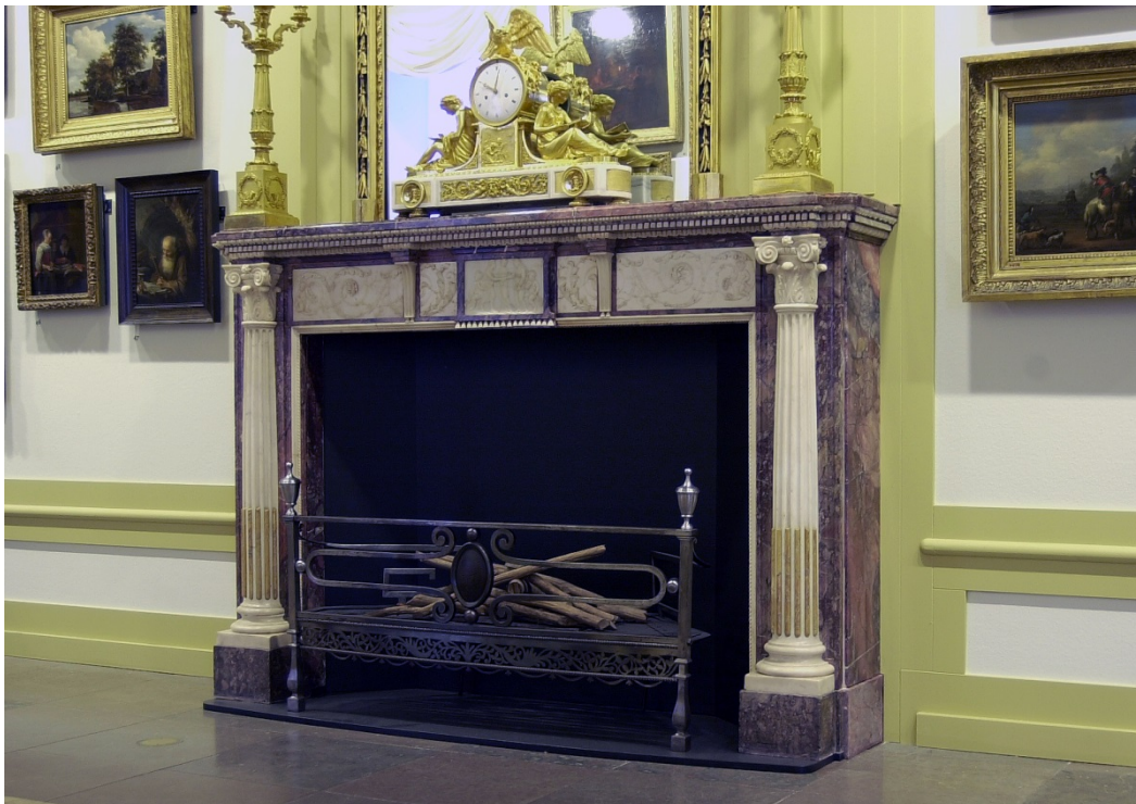
Afb. 3 De schouw van Keizersgracht 185 na de restauratie in 2004 t.b.v. de tentoonstelling 'Het Geschenk'. In 1896 was de schouw wat dieper gemaakt door het marmer van de zijkanten te verzagen en de dekplaat daarmee te verbreden. Dit is bij de laatste restauratie van 2004 weer zoveel mogelijk ongedaan gemaakt.

Vrijwel steeds werden de interieurs bij deze recente exposities ontdaan van de latere toevoegingen uit het Stedelijk en zoveel mogelijk teruggerepareerd naar hun oorspronkelijke staat.