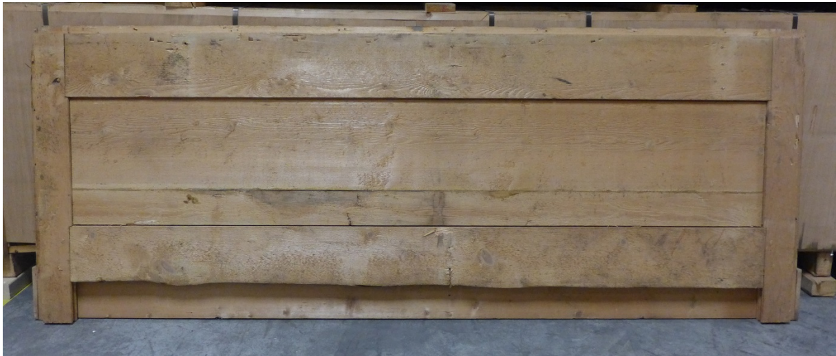
Afb. 8 Achterzijde van een origineel lambriseringdeel

Vooraf aan de achterzijde van de betimmering is nog goed herkenbaar wat origineel uit 1802 is en wat later vanaf 1896 is toegevoegd. Het originele naaldhout is namelijk nog gezaagd door een houtzaagmolen. Timmerlieden konden hun planken daar op iedere gewenste dikte gezaagd krijgen en hoefden dan alleen de zichtzijden te schaven. De achterzijde bleef ruw en vertoont de typische molenzaagsporen en vezeligheid van het nat gezaagde hout.