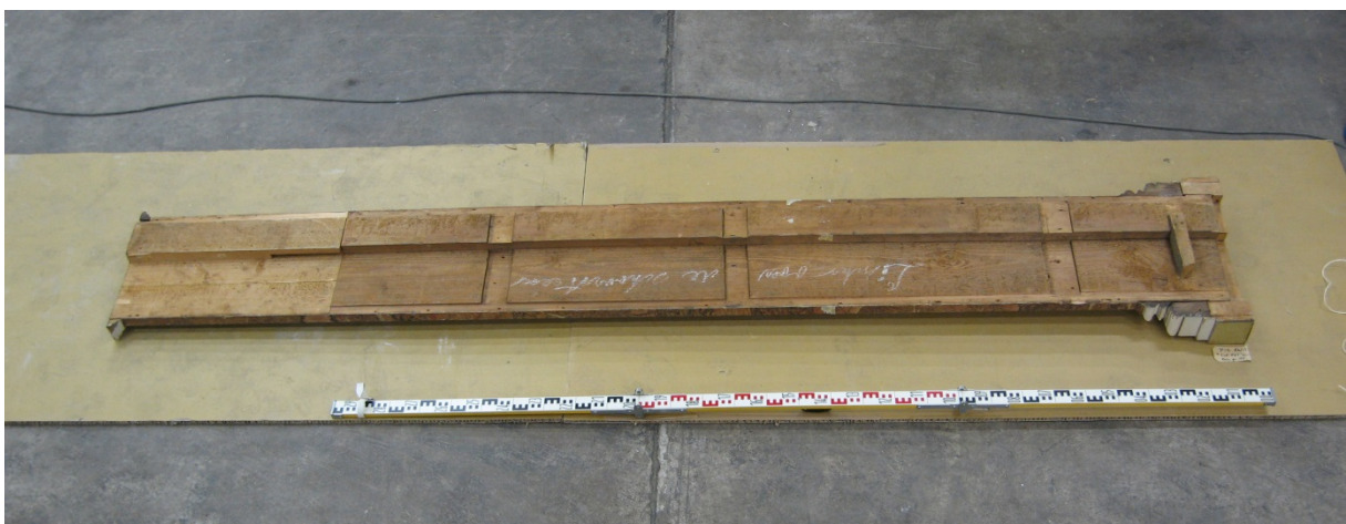
Afb. 5 Achterzijde pilaster