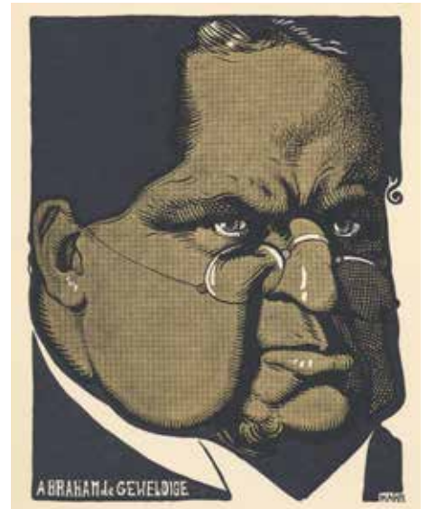
Spotprent van de politicus Abraham Kuyper. Door Albert Hahn, 1904.