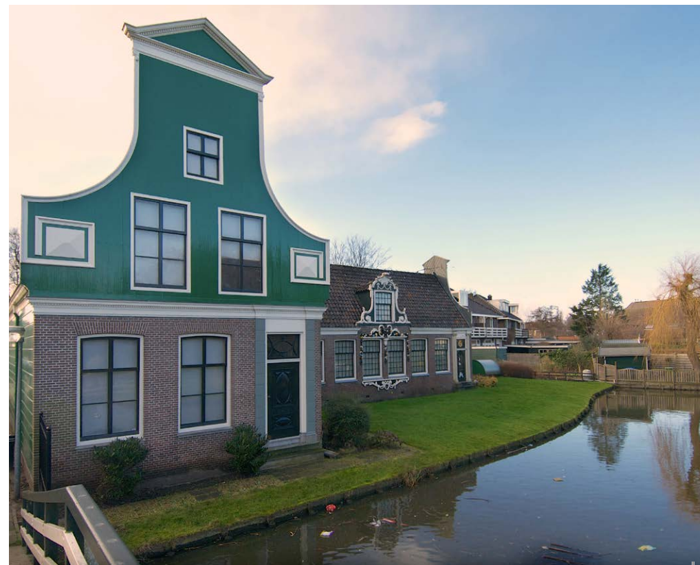
Molenmuseum in Koog aan de Zaan

De traditie van succesvol cultureel ondernemerschap wordt voortgezet door de internationaal bekende ontwerper Piet Boon. Hij heeft in Oostzaan zijn thuisbasis. Piet Boon® Store, Skoon 78, Oostzaan. Geopend ma-za van 10 tot 17 uur. www.pietboon.nl