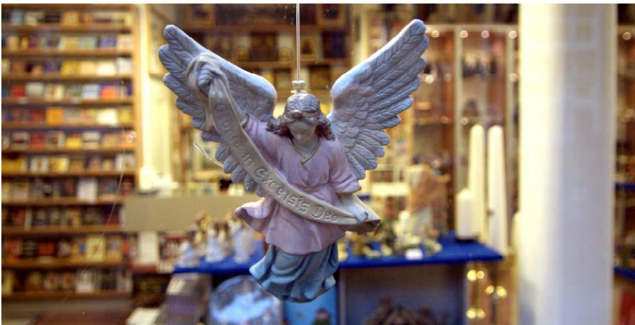
Engel in de Abdij van Egmond

toen de kustlijn nog veel verder landinwaarts lag dan nu. Limmen heeft een middeleeuwse dorpskern . De Hervormde Kerk is de oudste kerk van Noord-Holland. Hij is terug te voeren tot vóór 740 na. Chr. Hervormde Kerk, Zuidkerkenlaan 25, Limmen.