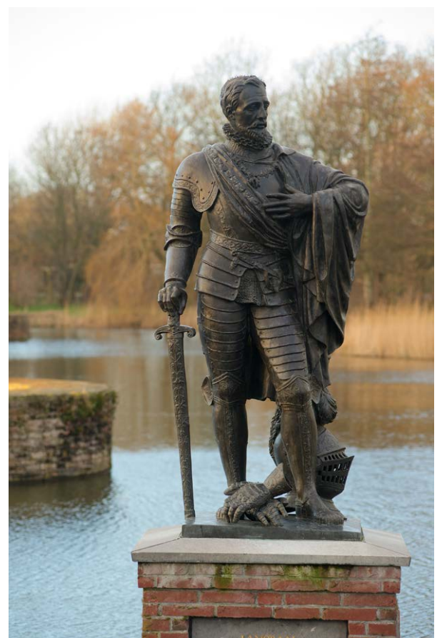
Egmond aan de Hoef, beeld van Lamoraal van Egmond voor de ruïne

Op het pleintje voor de Nederlandse Hervormde Kerk in het dorp staat een beeld van Maerten van Heemskerk, een van de belangrijkste Hollandse schilders uit de zestiende eeuw. Het is gemaakt ter ere van zijn 500e geboortedaag. Op het kerkhofje staat een door Van Heemskerk ontworpen azuurstenen obelisk ter nagedachtenis aan zijn vader. De geschiedenis van het statige Kasteel of Huis Marquette gaat net als Slot Assumburg terug tot de 13e eeuw. Het toen robuuste rondeelkasteel diende als verdedigingswerk tegen de West-Friezen. In de