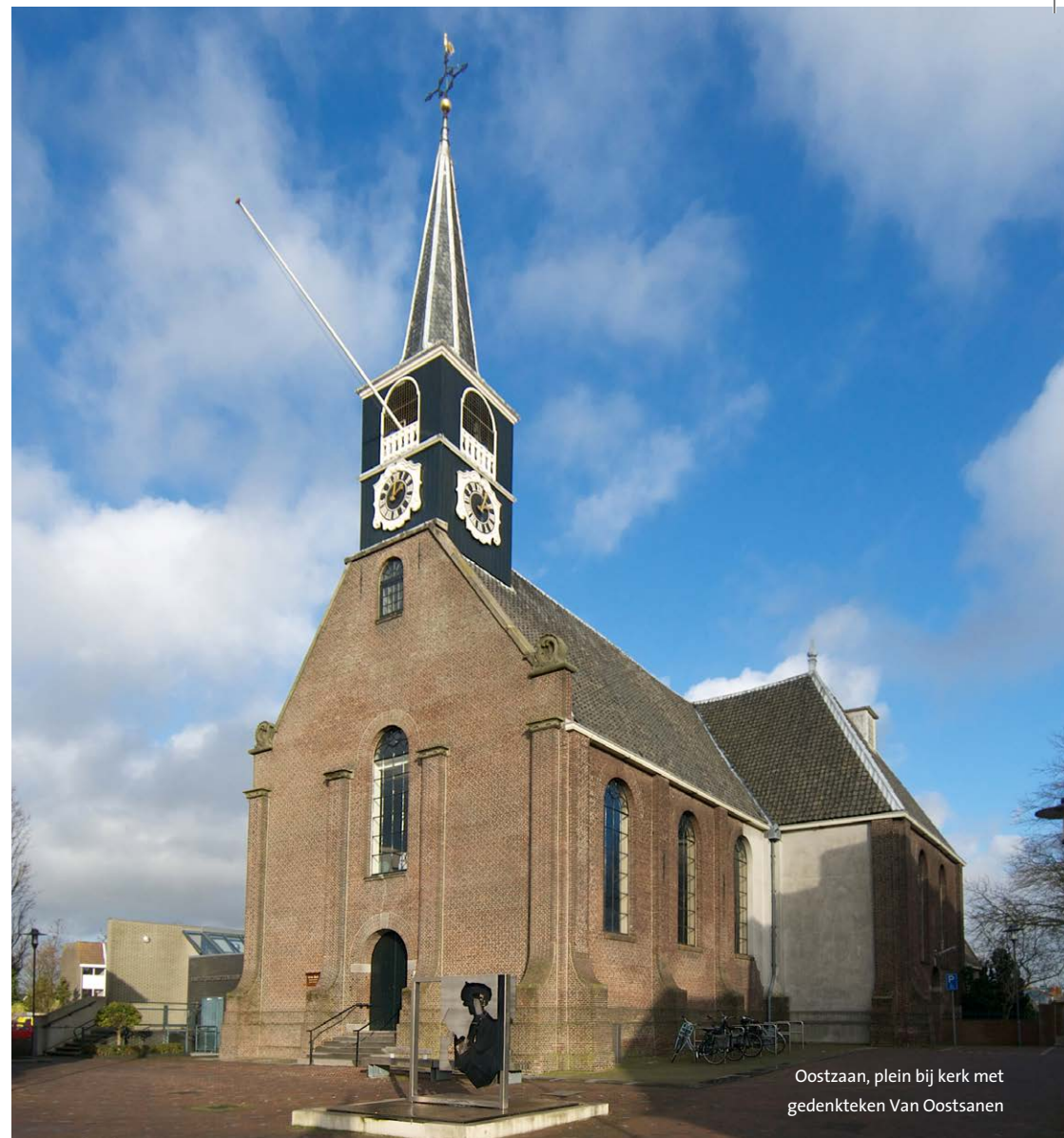
Oostzaan, plein bij kerk met gedenkteken Van Oostsanen

H Ga bij de stoplichten links de ring van Alkmaar op (N9) en bij de eerste stoplichten rechts. Volg de Bergerweg, na de rotonde komt u bij het oude centrum van Alkmaar.