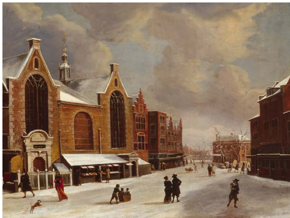
17e-eeuwse winterse afbeelding waar de samenvoeging van de twee kapellen te zien is

10 Naast een van de grote stadspoorten, de Sint-Olofspoort , werd tussen 1440 en 1450 een gelijknamige kapel gebouwd. De poort en de kapel stonden aan het begin van de Zeedijk, die bescherming bood tegen het water van het IJ. Omstreeks 1490 werd naast de kapel een achthoekige kapel aangebouwd, de Jeruzalemkapel of Heilige Grafkapel. In de kapel stond een kopie van het Heilige Graf, het monument dat in Jeruzalem was gebouwd op de plek waar Christus begraven zou zijn.