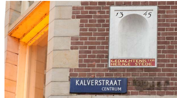
Kalverstraat, 'Gedachtenis ter Heilige Stede'

Bereikbaarheid 15 minuten lopen vanaf Amsterdam Centraal Station (startpunt vanaf 10) Tramlijnen 1, 2, 5 (halte Spui), 9, 14, 16, 24 (halte Rokin)