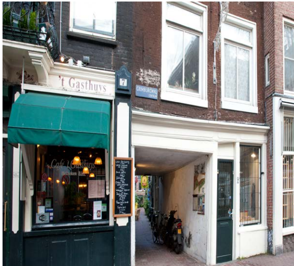
Gebed zonder End

In 1452 brandde de kapel tijdens een hevige stadsbrand helemaal af, net als veel andere gebouwen. In 1470 werd de nieuwe kapel, die u nu ziet, ingewijd. Na 1578 hield het klooster op te bestaan en hier werd vanaf 1632 het nieuwe Athenaeum Illustre gevestigd, een verre