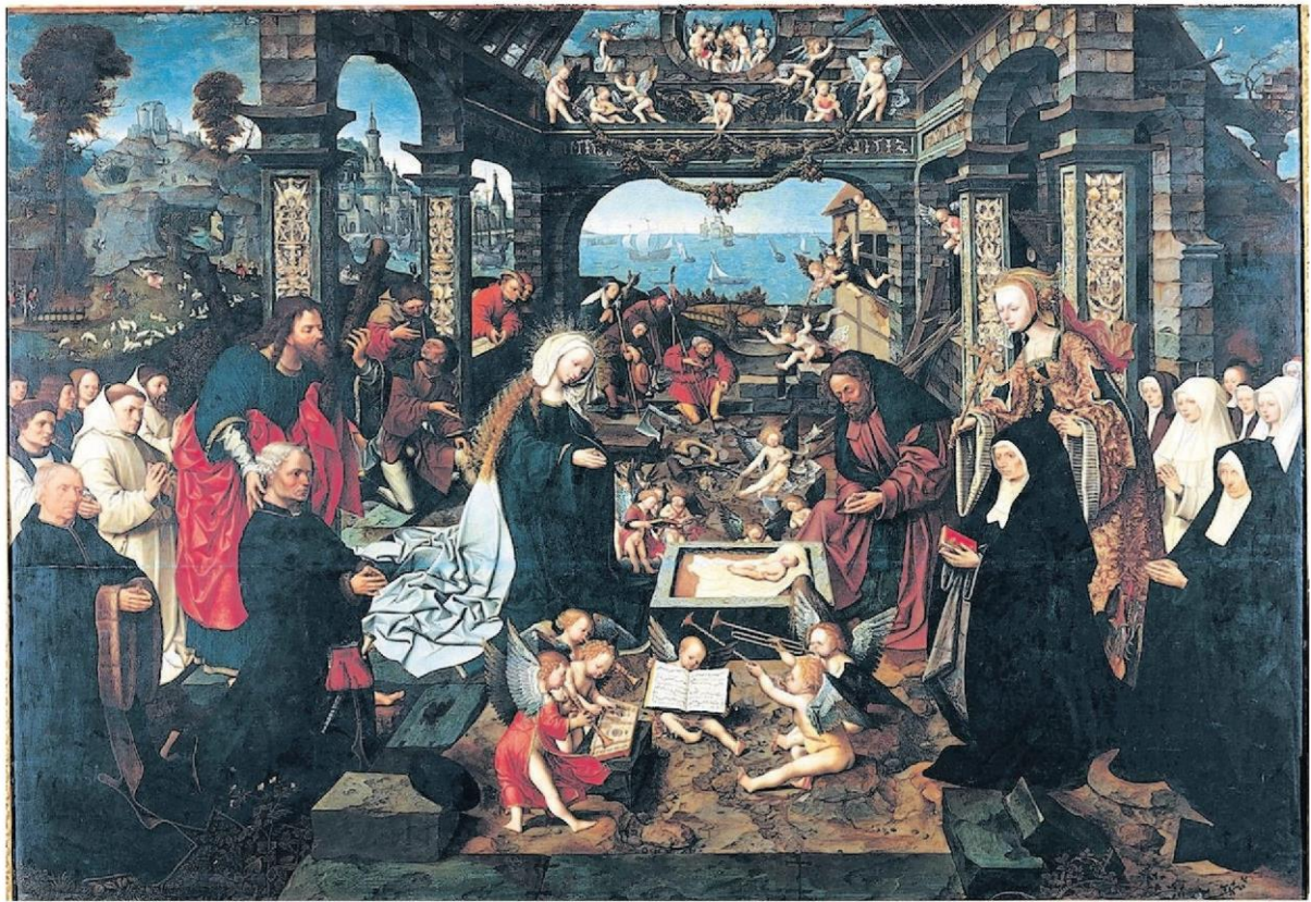
Jacob van Oostsanen: Oegeboorte van Christus met aanbidding der koningen en familie Boelen (1512).