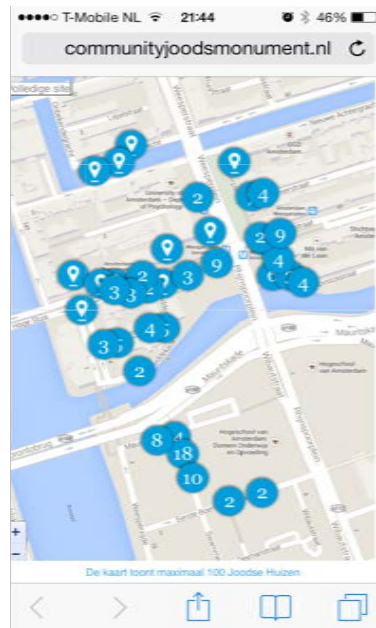
Figuur 6: Adressen waar Joodse families woonden via de Joodse Huizen App

In het algemeen kun je zeggen dat er meer internet in de 'echte wereld' komt waardoor je niet meer altijd achter de computer hoeft te blijven zitten. Bij het bepalen van een publieksprijs, bijvoorbeeld, was er bij een open dag in de Stadschouwburg een scherm waar mensen met hun OV-chipkaart online konden stemmen door hem tegen de band aan houden die ze het leukst vonden. In twee uur kwam daar de prijs uitrollen. De Google-glass is ook een voorbeeld waarmee je op straat dingen kunt zien van internet terwijl je bijvoorbeeld naar een gebouw staat te kijken. Net als het mobieltje wat we 10 jaar geleden een debiel ding vonden zou het kunnen zijn dat we dit Google-product over 10 jaar heel gewoon vinden. Dit zijn voorbeelden waarmee we in de workshop aan de slag kunnen om te verzinnen hoe je de verhalen uit de website op nieuwe manieren naar de mensen toe kunt brengen.