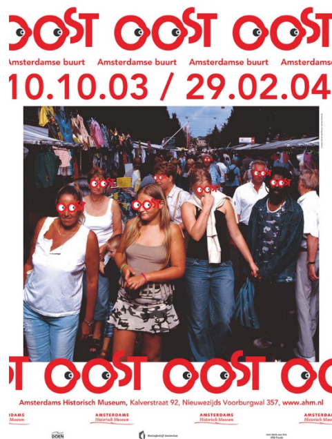
Figuur 1: Poster tentoonstelling Oost - een Amsterdamse buurt 2003

De aanleiding van dit symposium zit in het 10-jarig bestaan van allerlei online buurtgeheugens in Amsterdam. De lancering van één van die geheugens is op 11 oktober 2013 bijna precies 10 jaar geleden. Op 10 oktober 2003 opende het Amsterdam Museum namelijk een tentoonstelling met de titel “Oost - Amsterdamse buurt” (zie Figuur 1). In de aanloop daar naar toe waren buurtbewoners getraind om buurtherinneringen te verzamelen voor op een nieuwe website die het Geheugen van Oost heette. Verhalen verzamelaars kregen daarvoor T-shirts met daarop “I make History” gedrukt. Maar ook andere websites met herinneringen zagen ongeveer 10 jaar geleden het daglicht: het Geheugen van Plan Zuid, het Geheugen van West, het Historisch Archief van de Baarsjes. In totaal meer dan 30 geheugens 3 uit Amsterdam zijn uitgenodigd voor het vieren van dit gezamenlijke jubileum. De doelen van het symposium bestaan uit elkaar ontmoeten, van elkaar leren en, in het bijzonder, met elkaar bespreken hoe we de volgende 10 jaar online buurtgeheugens in de stad zouden willen vormgeven.