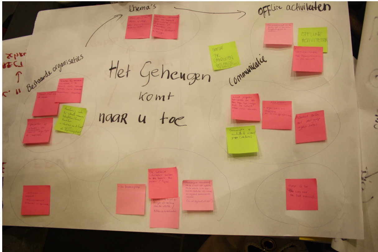
Figuur 7: Een van de flipovers uit de workshops

Elke presentatie gaf een basisthema om van daaruit in een workshop naar de toekomst te kijken van de online buurtgeheugens in Amsterdam. Hieronder volgend die thema's nog een keer met een samenvatting van de plannen die ontstaan zijn.