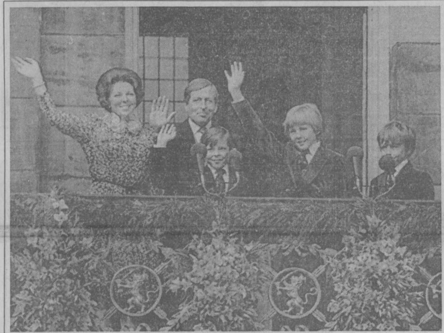
De nieuwe koninklijke familie op het balkon.

kers er nog inzaten. De Mobile Eenheid trok zich op dat tijdstip terug. Niet duidelijk was of zij hun geleerden wilden hergroepen. Volgens een woordvoerder van de politie werd niet tegen krakers opgetreden maar uitsluitend tegen „mensen die het verkeer belemmeren". In Den Haag hebben enkele tientallen jongeren geprobeerd de Ridderzaal te bestormen. Een actievoerder trachtte met een koevoet de deur te forceren, die daardoor flink werd beschadigd. De man is aangehouden, evenals twee meisjes. Tevoren had de groep gedemonstreerd voor het paleis Noordeinde. In de loop van vanmorgen is de Posthoornkerk in de Amsterdamse Haarlemmerstraat gekraakt. De politiewoordvoerder, die dit mededeelde, wist niet hoeveel krakers de kerk zijn binnengedrongen. Volgens de politie was men niet voornemens tegen de krakers op te treden. Al eerder toen de nieuwe koningin en haar moeder op het balkon verschenen, was bij de Bijenkorf een rookbom ontploft. De dader werd aangehouden evenals drie journalisten, die zich volgens de politie, met de arrestatie bemoeiden. Hardhandig werkten de rechercheurs het groepje in een rook busje. Ook later ontstonden moeilijkheden tussen politie en pers. Twee journalisten, een Duitse en een van de Nederlandse GPD, raakten hun accreditatie kwijt omdat zij - aldus de politie - door de afzetting heen wilden lopen. Drie andere journalisten werden gearresteerd omdat zij een actie van de politie zouden hebben willen verhinderen.