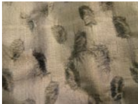
Rok vóór en na restauratie.