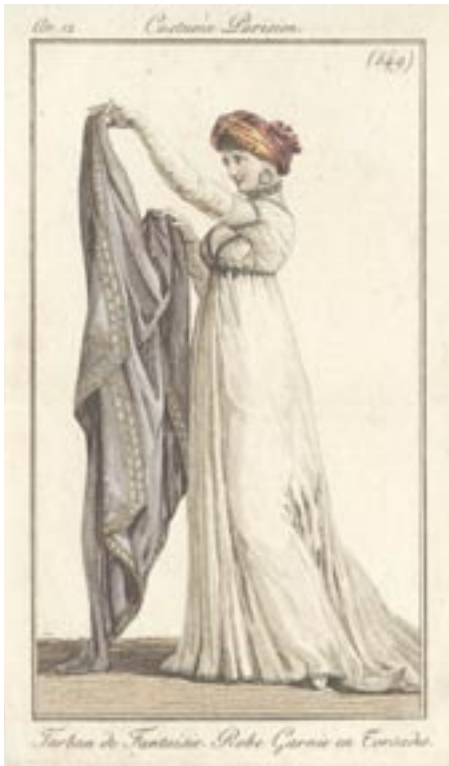
Costume parisien, An 12 (1803-1804).

mode, die meer natuurlijke lichaamsvormen laat zien en lossere valt. Al voor 1800 is de hoge taille in Nederland te zien. Regelmatig zijn bestaande japonnen vermaakt en aangepast aan de nieuwe mode, zoals deze roomkleurige japon. De geborduurde zijde dateert uit circa 1785-1790, terwijl het model met de hoge taille en strakke mouwen zeer modieus is voor de jaren 1797-1800. De japon heeft een gevoerd lijfje, gevoerde mouwen, een rok met sleep en twee zijsplitten. Na 1800 worden japonnen vaak ongevoerd gedragen en valt de rok vanuit de hoge taillelijn sluk neer. De sleep en splitten zijn dan vervallen. Dit model geldt als voorloper van de nieuwe Empire-mode.