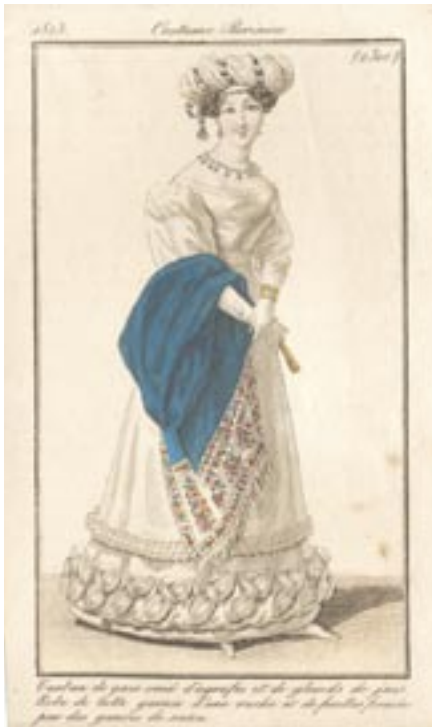
Costume parisien, 1825.

De Vak- en Huishoudschool Prinses Irene is voortgekomen uit de Vakschool voor Vrouwen- en Kinderkleding, opgericht in 1909.