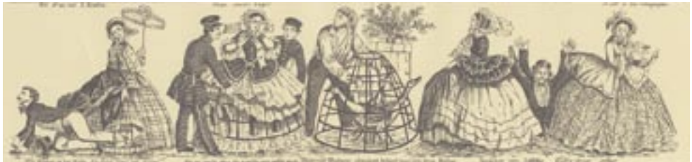
Heur et malheur de la crinoline , spotprent op de crinoline in 21 taferelen (detail), Frankrijk, ca. 1856.

De crinoline is een geliefd onderwerp geweest om de spot mee te drijven. De enorme omvang van de rokken zorgt regelmatig voor bewegingsproblemen in huis of in openbare gelegenheden. Er is dan ook veel kritiek: het gevaar bij open haarden en kaarsen is groot. In kranten is regelmatig melding gemaakt van slachtoffers die de crinoline maakte. In de jaren zestig van de negentiende eeuw zorgt een grote brand in de kathedraal van Santiago voor tweeduizend slachtoffers. De brand is veroorzaakt door een tule strook op een wijde japon die in aanraking kwam met een van de kaarsen. Een ander voorval meldt de Ierse krant Clare Journal and Ennis Advertiser op 6 januari 1862: 'Another girl burnt to death through crinoline.' Door een kaars vat haar crinoline vlam en de vrouw overleeft de verwondingen niet.