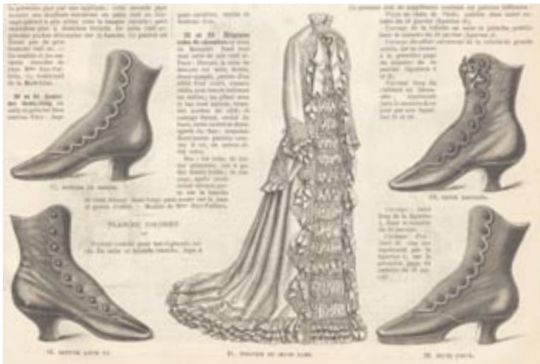
Detail uit Revue de la Mode , 6 février 1881. Amsterdams Historisch Museum.

Halve laarsjes zijn gedurende de negentiende eeuw vooral mode voor wandelen en paardrijden; gekleurde laarsjes worden enorm populair. Na 1850 zijn ze meer dan enkelhoog. Ook de hakhoogte neemt toe. Halverwege de negentiende eeuw komt de massaproductie op gang en kunnen niet alleen welgestelde dames, maar ook de werkende dienstbodes zich laarsjes permitteren. De laarsjes bedekken de gehele voet en zijn met zijden stoffen en borduursels versierd.