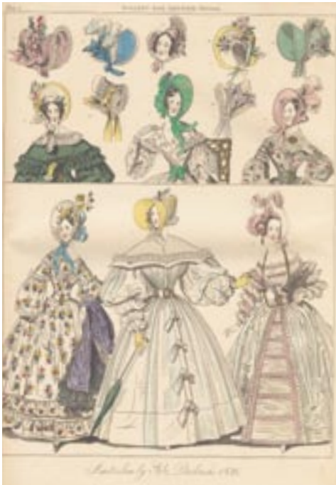
Psyche, galerij der nieuwste modes, july 1836, plaat 2. Amsterdam Historisch Museum.

Het model van deze japon loopt achter op de heersende mode, want de mouwomvang is wat groot voor die tijd. Rond 1840 is een lange gladde mouw bereikt.